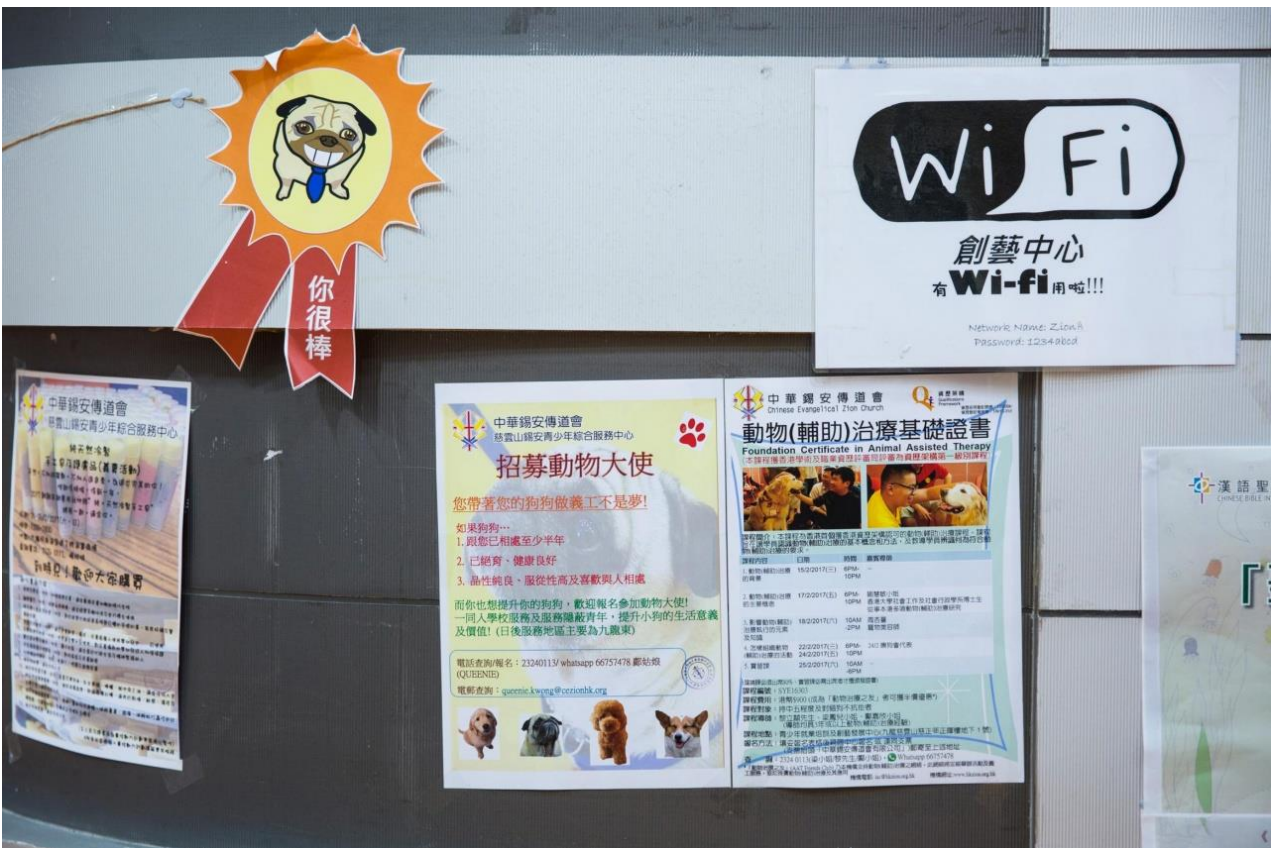
中華錫安傳道會推行的「重拾動力－動物治療青年計劃」，歡迎大家帶動物來做義工。